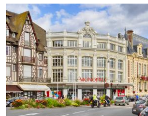
Trouville (14)

ATOUT PIERRE DIVERSIFICATION présente à la fin du 1 er trimestre un surinvestissement avoisinant 44 M€. Le ratio d'endettement reste très mesuré : 9,34% pour un maximum autorisé par l'Assemblée Générale de 30% et une moyenne nationale 2025 toutes SCPI de 18,3%.